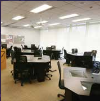
Decision Sciences Technology Laboratory 決策科學科技實驗室