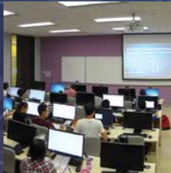
Applied Statistics Laboratory 應用統計實驗室