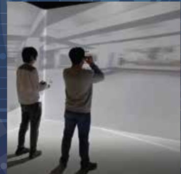
Virtual Reality and Big Data Analytics Laboratory 虛擬實境及大數據分析研究實驗室